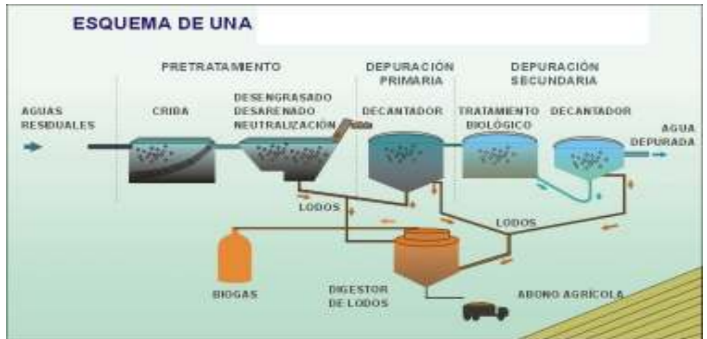
Imagen contenidos CREA, materiales Junta de Andalucía

Esquema de una... Estación depuradora de aguas residuales