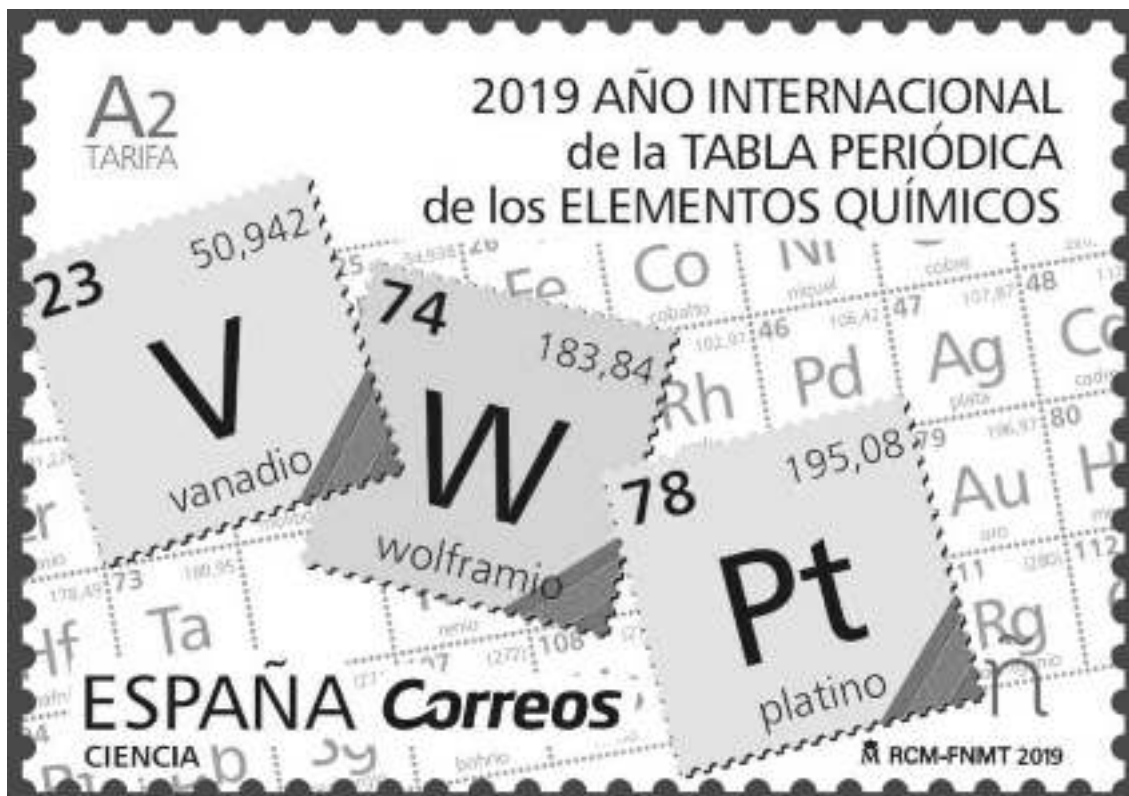
Sello conmemorativo del Año Internacional de la Tabla Periódica.