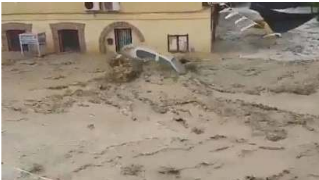
Figura 2. Desastre en Cebolla (Toledo).