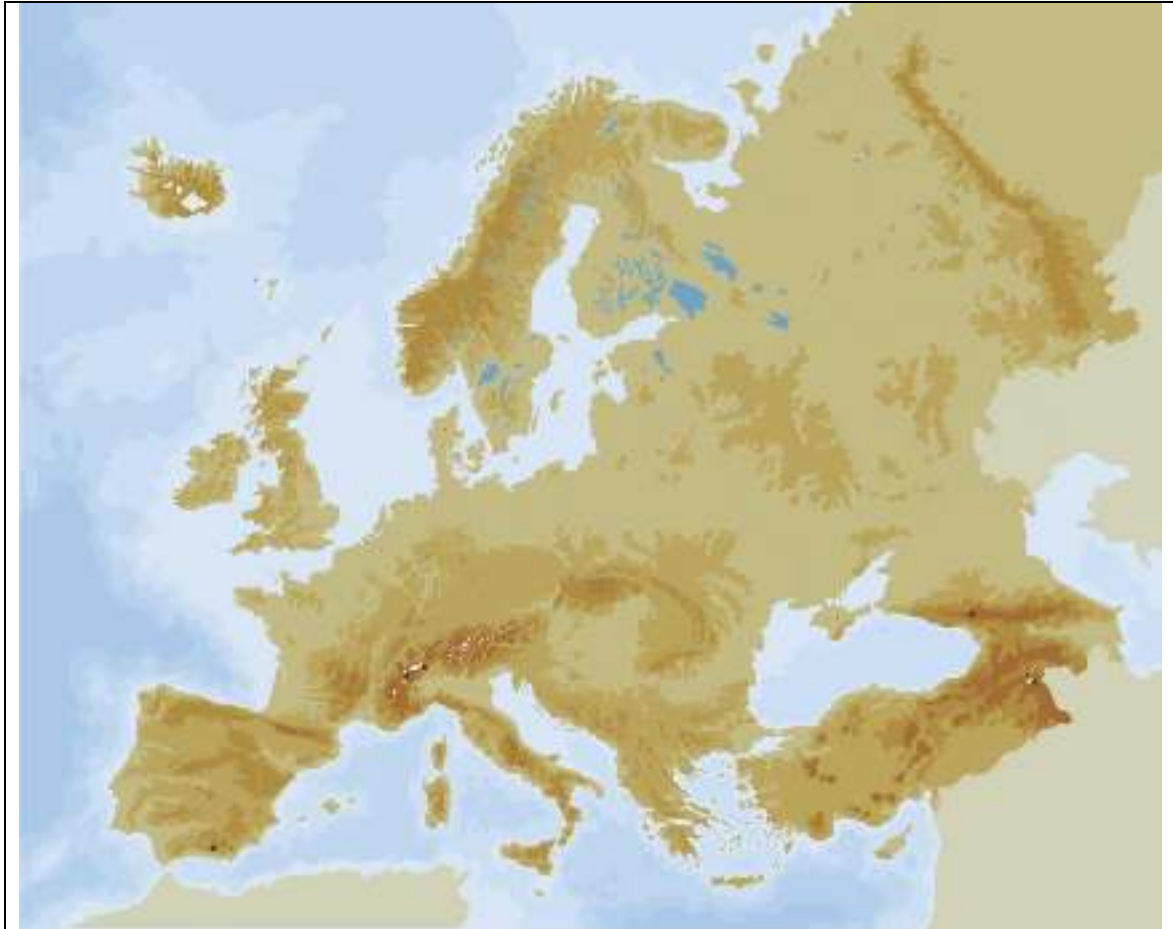
Imagen2: Mapa mudo físico de Europa

Los Pirineos - Península Escandinava - Montes Urales - Los Alpes - Los Cárpatos