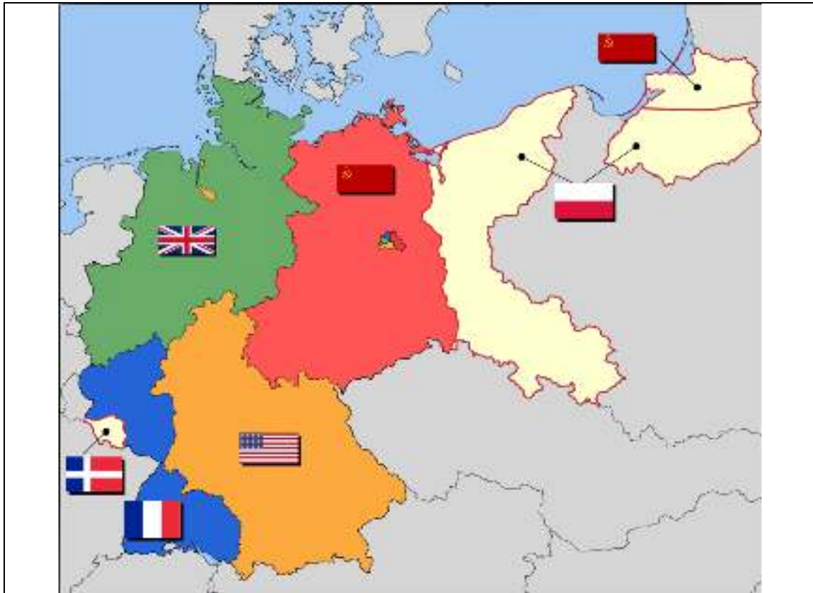
Imagen: 1