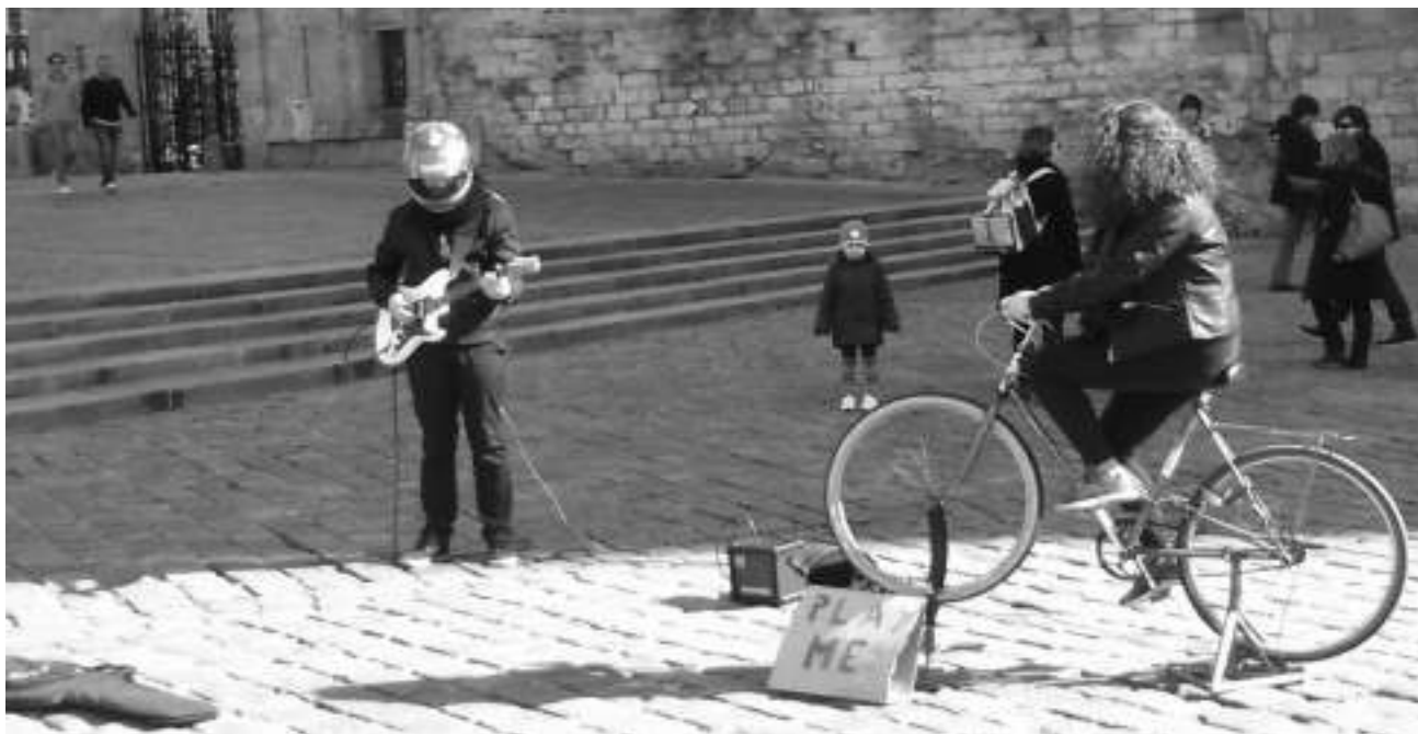
Ressource du professeur.