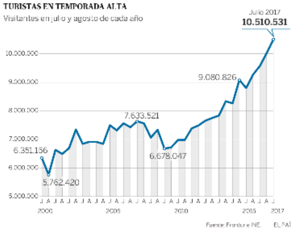
Gráfico de El País de dominio público

5. Comenta la siguiente gráfica sobre la evolución del turismo en España utilizando entre 120 y 150 palabras. Ten en cuenta ideas como las causas del crecimiento del número de turistas, consecuencias del mismo, tipo de turismo destacado en España, lugares de destino preferentes y origen del turismo. (2,5 puntos)