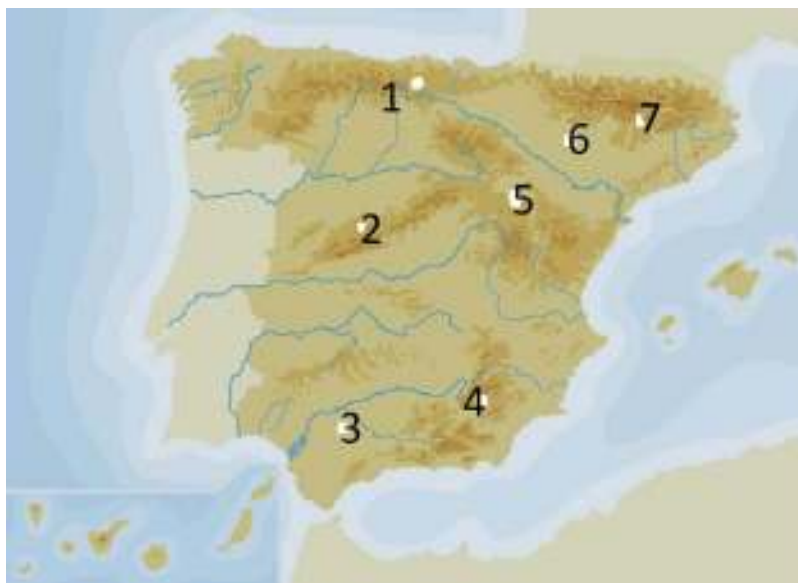
Imagen de CREA, Junta de Andalucía

1. Observa el siguiente mapa de España y responde a las preguntas que aparecen a continuación: (2,5 puntos; 0,7 los apartados A y B, 0,3 los apartados C y E y 0,5 el D)