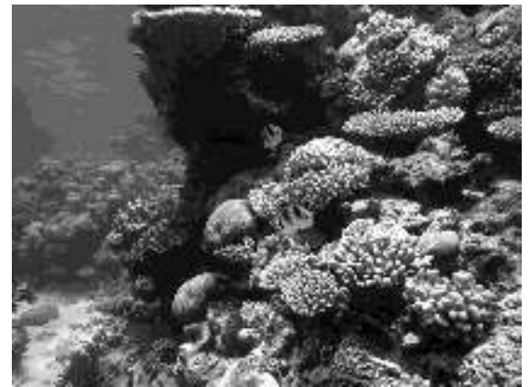
Esculls coral·lins / Arrecifes coralinos

Els esculls coral·lins constitueixen un dels ecosistemes marins més rics i diversos. Els pòlips que construeixen els esculls són animals, però dins del cos tenen un gran nombre de petits grànuls groguencs que contenen algues a l'interior. Aquestes algues aprofiten els productes d'excreció dels pòlips. També fan la foto- síntesi, per la qual cosa alliberen oxigen, que el pòlip utilitza per a respirar.