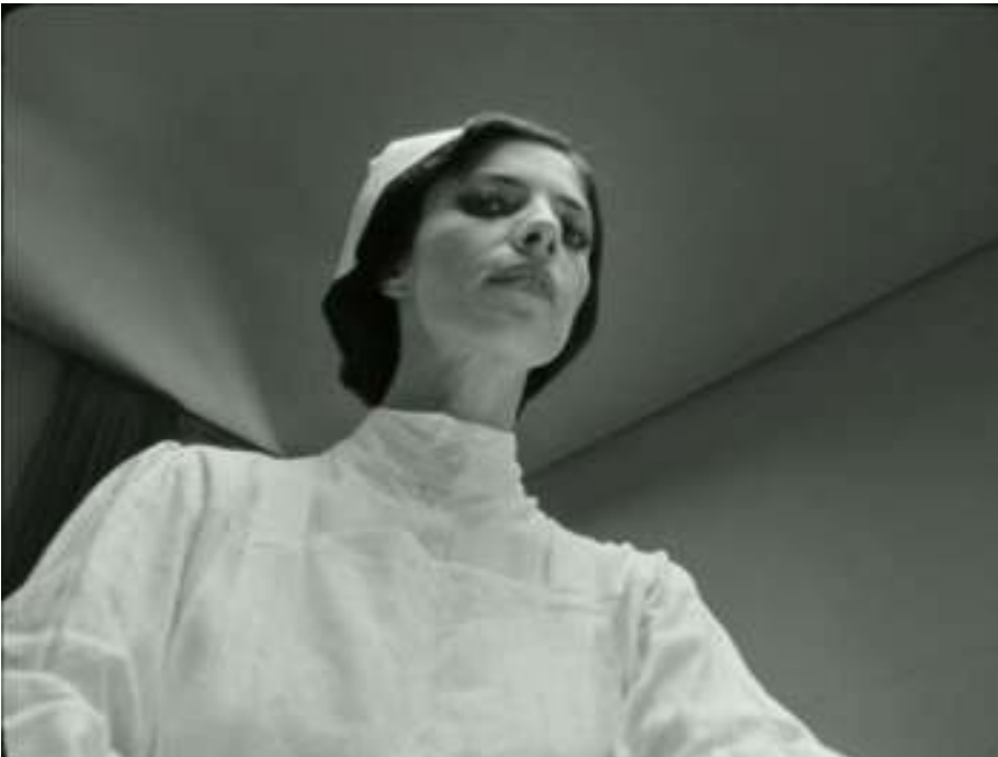
Fotograma de la película "Blancanieves" (2012) dirigida por Pablo Berger