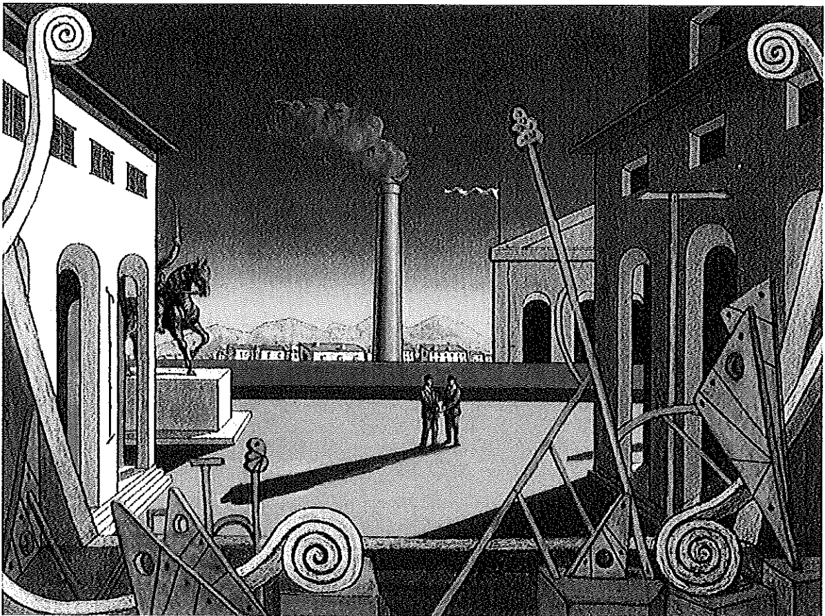
Giorgio de Chirico (1971) Gran Juego