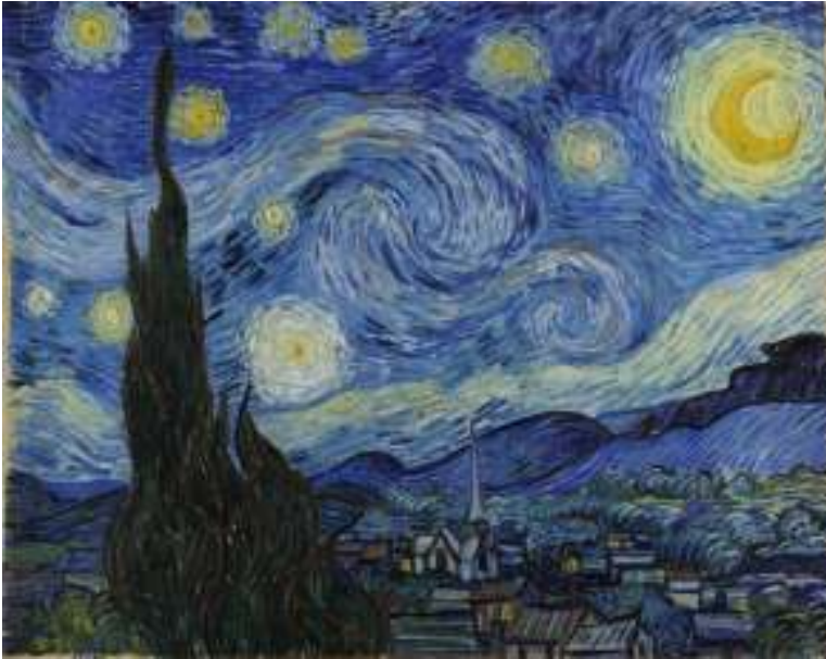
Lámina nº 3. La noche estrellada (1889), de Vincent van Gogh, Museo de Arte Moderno de Nueva York.