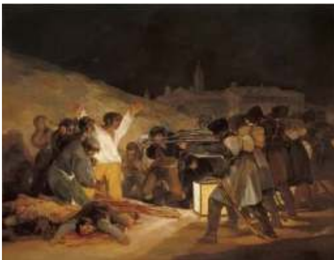
Lámina nº 1. Los fusilamientos (1814), de Francisco de Goya, Museo del Prado, Madrid.