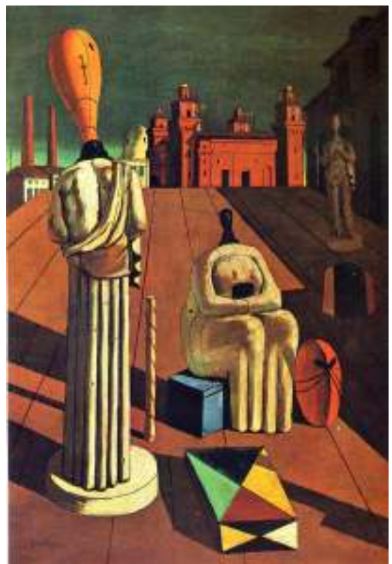
Lámina nº 4. Las musas inquietantes (1916), de Giorgio de Chirico, Colección particular.