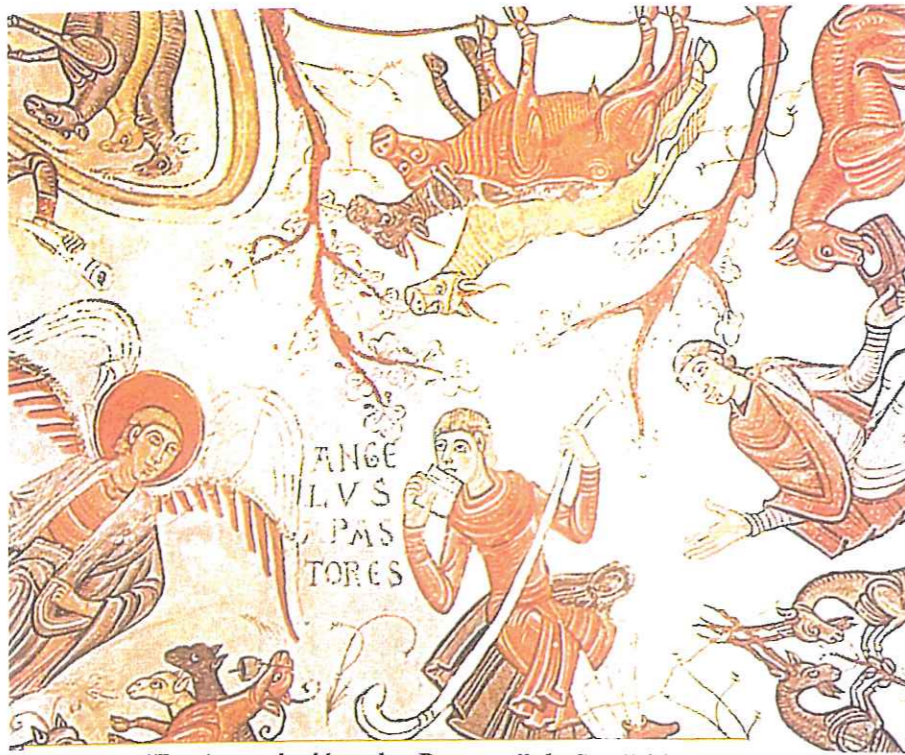
“La Anunciación a los Pastores” de San Isidoro de León