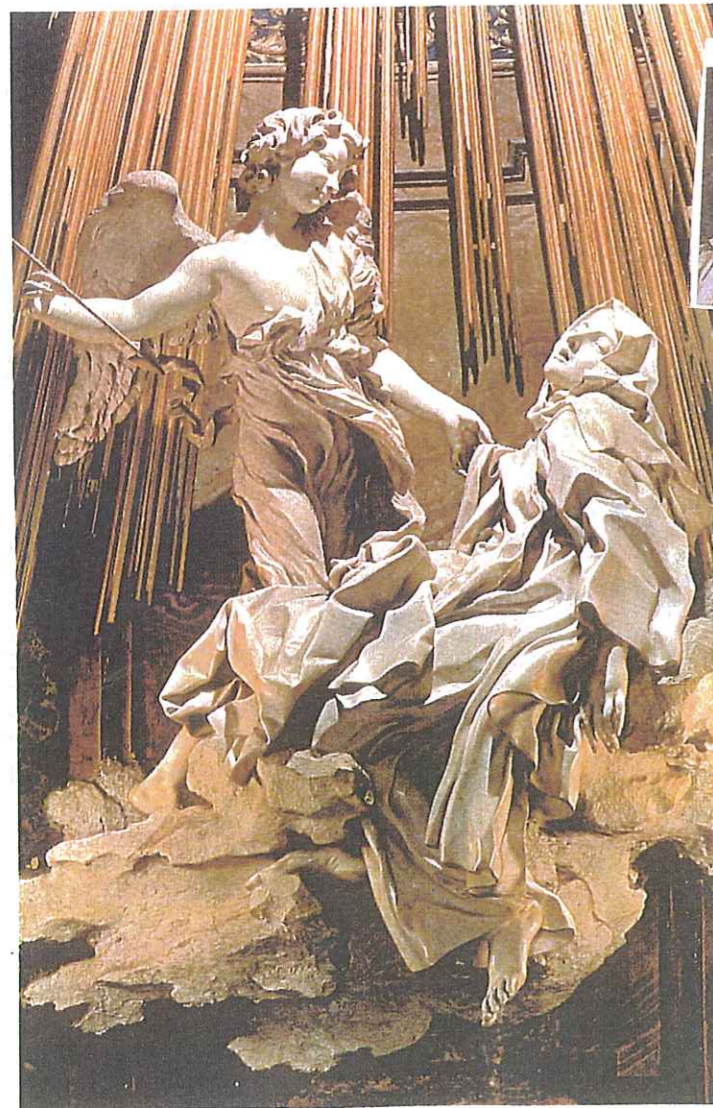
“El éxtasis de Santa Teresa”. Bernini