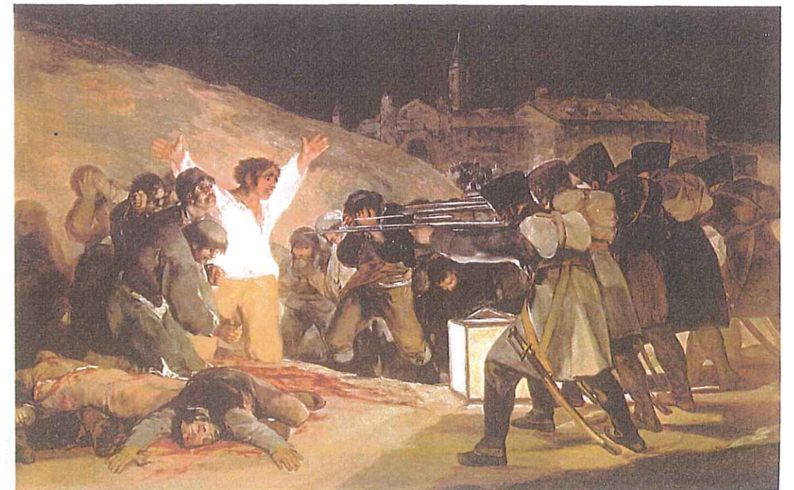
“Los fusilamientos del 3 de Mayo”. Francisco de Goya