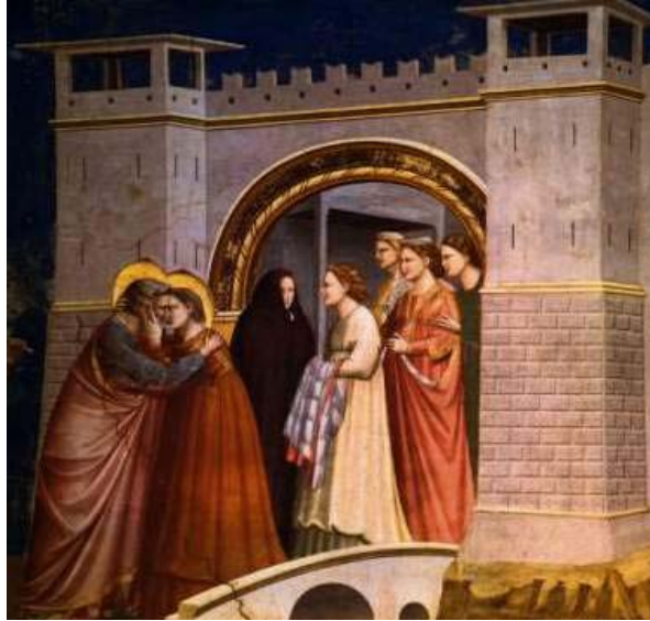
Abrazo en la puerta dorada 1304-06 Autor:Giotto di Bondone Museo:Capilla de los Scrovegni Material:Fresco 200 x 185 cm