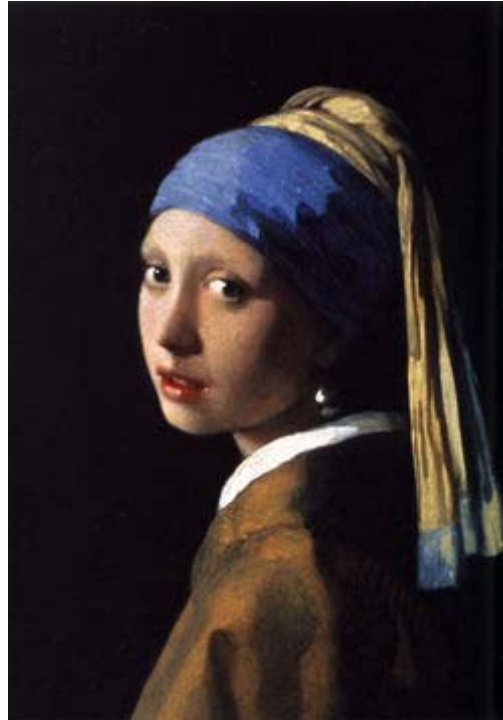
Joven con perla 1665-66 Autor: Vermeer de Delft Museo: Mauritshuis Material: Oleo sobre tabla 25'7 x 19 cm